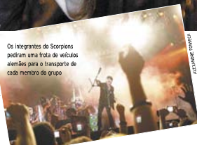
Os integrantes da Scorpions pediram uma frota de veículos alemães para a transporte de cada membro do grupo