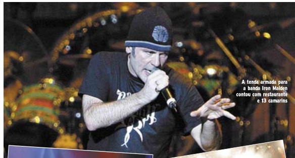
A tenda armada para a banda Iron Maiden contou com restaurantes e 13 camarins