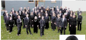
A peça foi interpretada pela Orquestra Sinfônica Collegium Musicum Potsdam