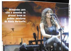
Brinquedos para cães e sementes de girassol foram os pedidos peculiares de Alanis Morissette