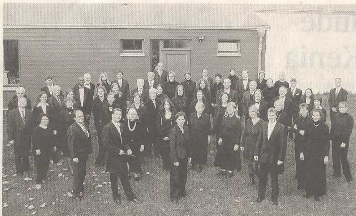
In Falkensee gern gesehen und gehört: Das Collegium Musicum Potsdam spielt am 13. Juni.